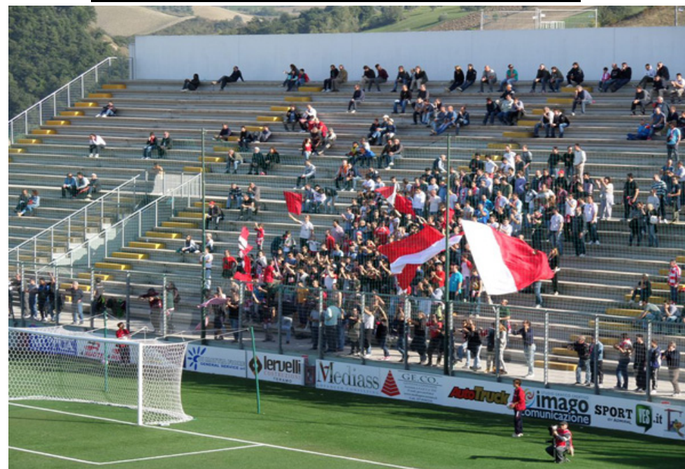
TERAMO - CHIETI 2013/2014

QUESTA FANZINE SI AUTOFINANZIA, QUINDI COME AL SOLITO UNA MANO SULLA COSCIENZA E L'ALTRA NELLA TASCA.