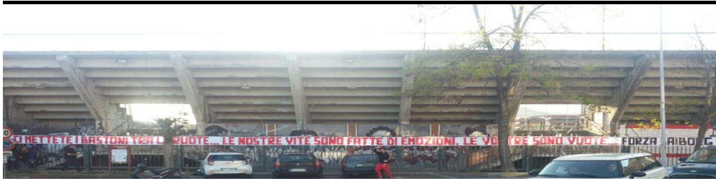
CI METTETE I BASTONI TRA LE RUOTE...LE NOSTRE VITE SONO FATTE DI EMOZIONI LE VOSTRE SONO VUOTE... FORZA SAIBORG